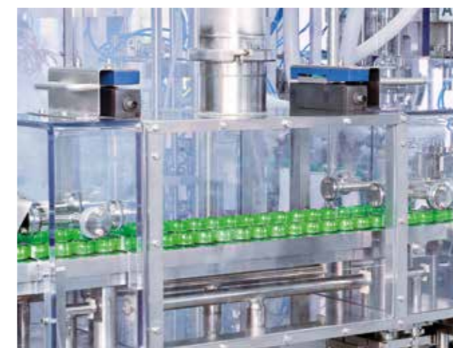
Wasserstoffperoxid Sterilisation der Spouts