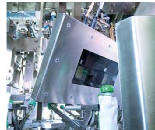
100 % Kontrolle per Kamera