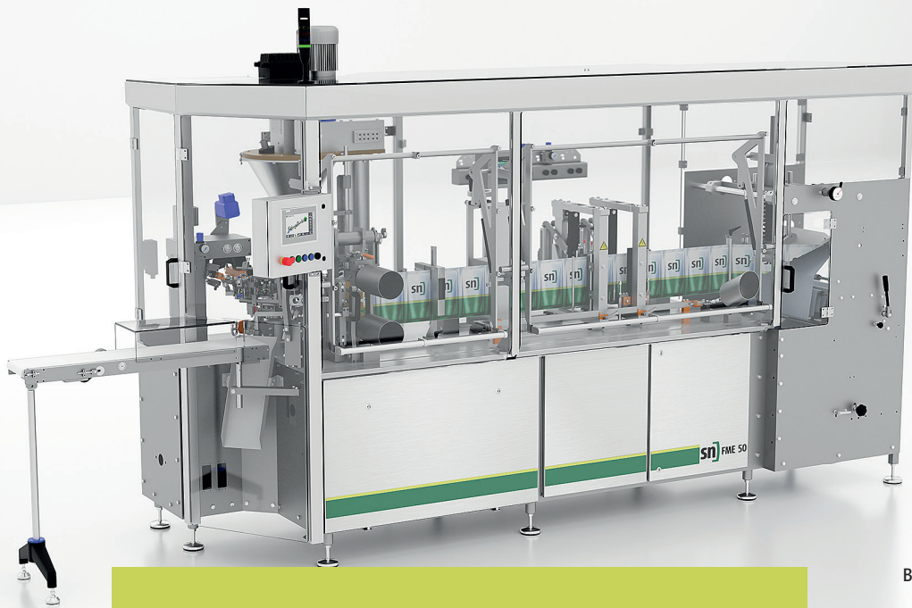
Bild zeigt Sonderausstattung.